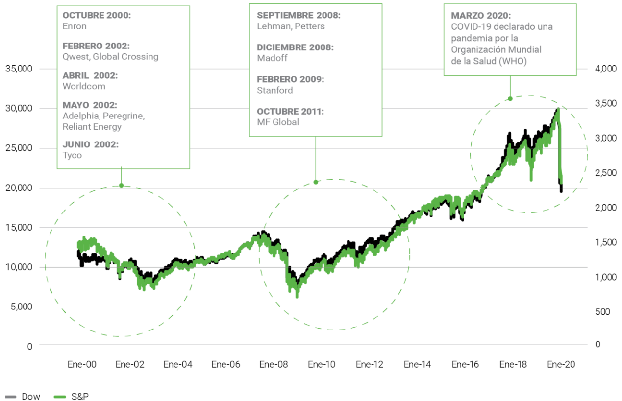
FIGURA 1: DESCUBRIENDO EL FRAUDE ENTRE LAS CAIDAS DEL MERCADO DE VALORES